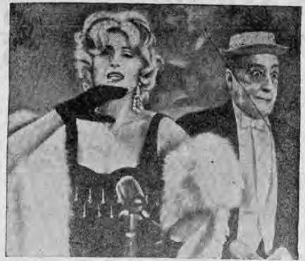
ANA MAGNANI y TOTO en una escena de "Ladrón Apasionado" que posiblemente para el mes de octubre estará en el país.

Agradecemos las palabras de Quesada y le deseamos muchos éxitos, ya que él tiene de sobra capacidad para cosecharlos.