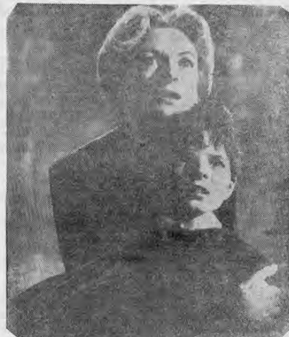
BARBARA KERR al frente del reparto que incluye dos notables infantes en la sensacional cinta titulada "The Innocents", cuyo argumento se basa en la creencia de que a dos niños se "los metieron" los espíritus, o mejor dicho, que están maléficos. El tema está tratado con gran sentido dramático y seriedad científica.