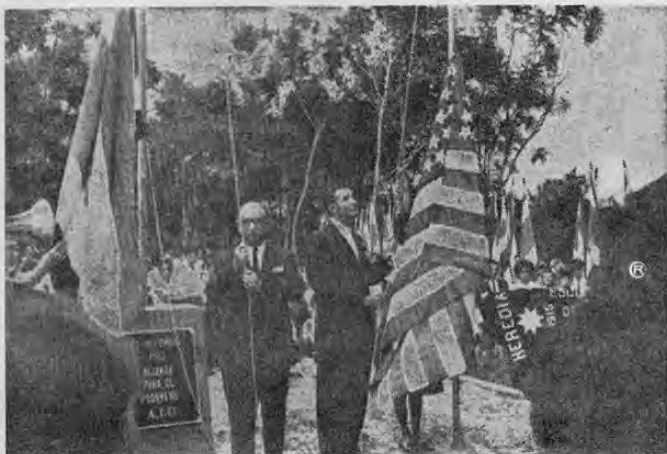
En la elocuente gráfica de Meza, el Presidente Orlich y el Embajador de los Estados Unidos Sr. Raymond Telles, cuando izaban simultáneamente las banderas de Costa