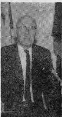
LOS PUBLICISTAS COMIENCEN MUCHOS ERRORES. — Raymond B. Nixon, famoso publicista y catedrático de Periodismo dice: "Muchos publicistas venían cometiendo grandes errores al creer que la efectividad comercial iba de acuerdo con el tiraje de los periódicos"

"No hace mucho, mediante un detenido estudio, se dieron a conocer los 10 mejores periódicos de Estados Unidos. Denominando como mejores periódicos, en el sentido moderno de la palabra, los que tienen mejores editoriales, información local, nacional, extranjera, etc., sin que tenga que ver en ello el tiraje y ni si-