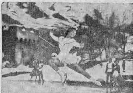
CAROL HAYES, famosísima por su exquisito dominio del patinaje sobre hielo. Campeona nacional de Estados Unidos y de competencias olímpicas. Es una de las atracciones extraordinarias de la cinta "Blanca Nieves y Tres Chiflados", que pronto estará en el país.

Los Tres Chiflados, aquellos incurribles excéntricos, que por generaciones han hecho las delicias de millones de aficionados al cine bufo, vuelven a lucirse en la mejor de sus formas en la nueva lujosa producción CinemaScope a colores por De Luxe BLANCA NIEVES Y LOS 3 CHIFLADOS, una creación de la 20th Century-Fox. Los Chiflados, como el título de la película lo indica, reemplazan, en esta nueva y original versión del famoso cuento de los hermanos Grimm, a los legendarios siete enanos de la fábula. En su papel de protectores de la bella y desgraciada princesita, los Chiflados hacen más travessuras que en toda su ruidosa carrera juntos. El argu-