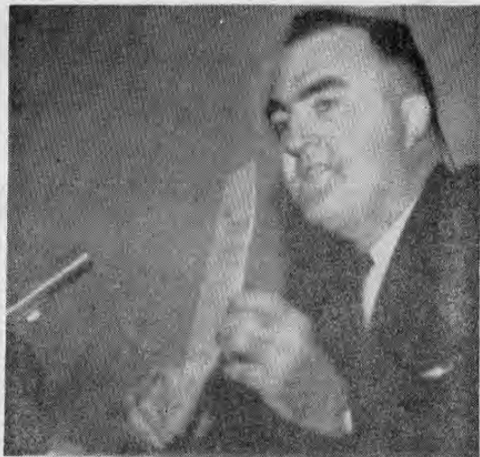
AQUELLOS QUE SE DEJARON IMPRESIONAR POR CIFRAS.—Scott M. Cutlip, famoso escritor, conocido mundialmente por sus libros sobre relaciones públicas: "... muchos encargados de relaciones públicas fracasaron porque se dejaron impresionar por cifras..."

Grandes maestros del periodismo y la publicidad mundial reunidos en Quito, Ecuador, en importante Seminario de Prensa, demuestran los errores cometidos por muchas agencias publicitarias en perjuicio de sus clientes al dejarse impresionar por cifras en el tiraje de algunos periódicos.