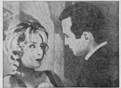
"LADRÓN APASIONADO", una preciosísima producción del "Ladrón" que presumía de ser muy elegante y de cometer grandes robos, por medio del amor y la cortesía sin par. Pero siempre terminaba en que nada robaba. Ben Gazzara, Anna Magnani, Fred Clark y Totó.